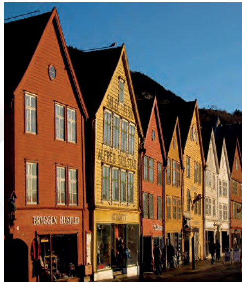
Bryggen i Bergen 2011

Velkommen til Bergen og lykke til med spillingen!