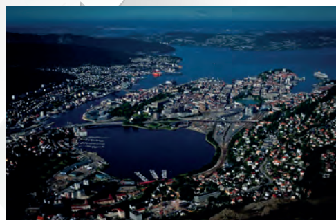
Bergen sett fra Ulriken